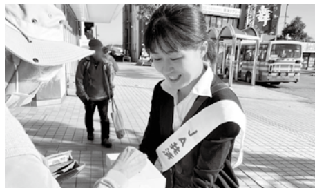
育英資金募金活動